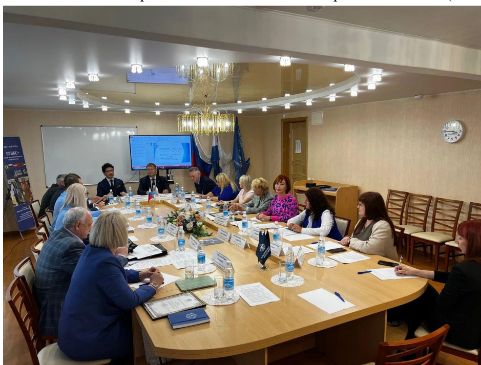
Собрание региональной общероссийской общественной организации «Ассоциация юристов России», Дальневосточный филиал ВАВТ Минэкономразвития, 2024 г.

ДВФ ВАВТ Минэкономразвития России является региональной площадкой общероссийской общественной организации «Ассоциация юристов России» (г. Москва).