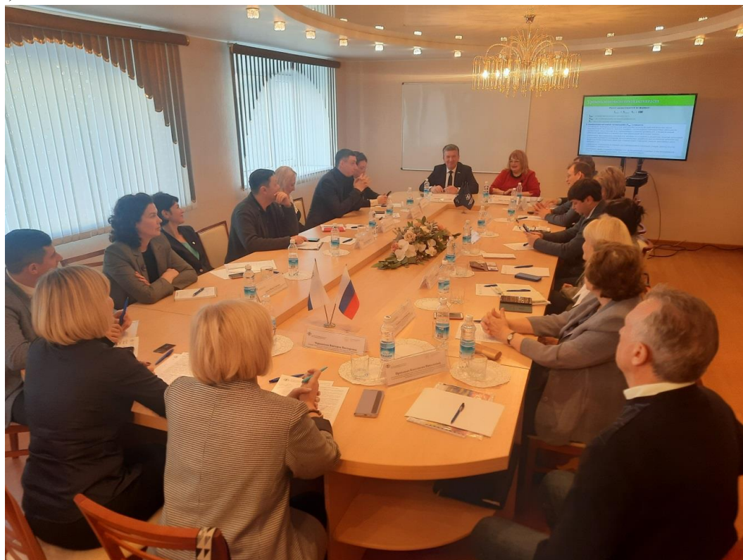
Собрание регионального отделения общероссийской общественной организации «Вольное экономическое общество России», Дальневосточный филиал ВАВТ Минэкономразвития России, 2024 г.

ДВФ ВАВТ Минэкономразвития России ведет активную научную и международную деятельность, являясь региональной площадкой и местом расположения регионального отделения общероссийской общественной организации «Вольное экономическое общество России» (г. Москва).