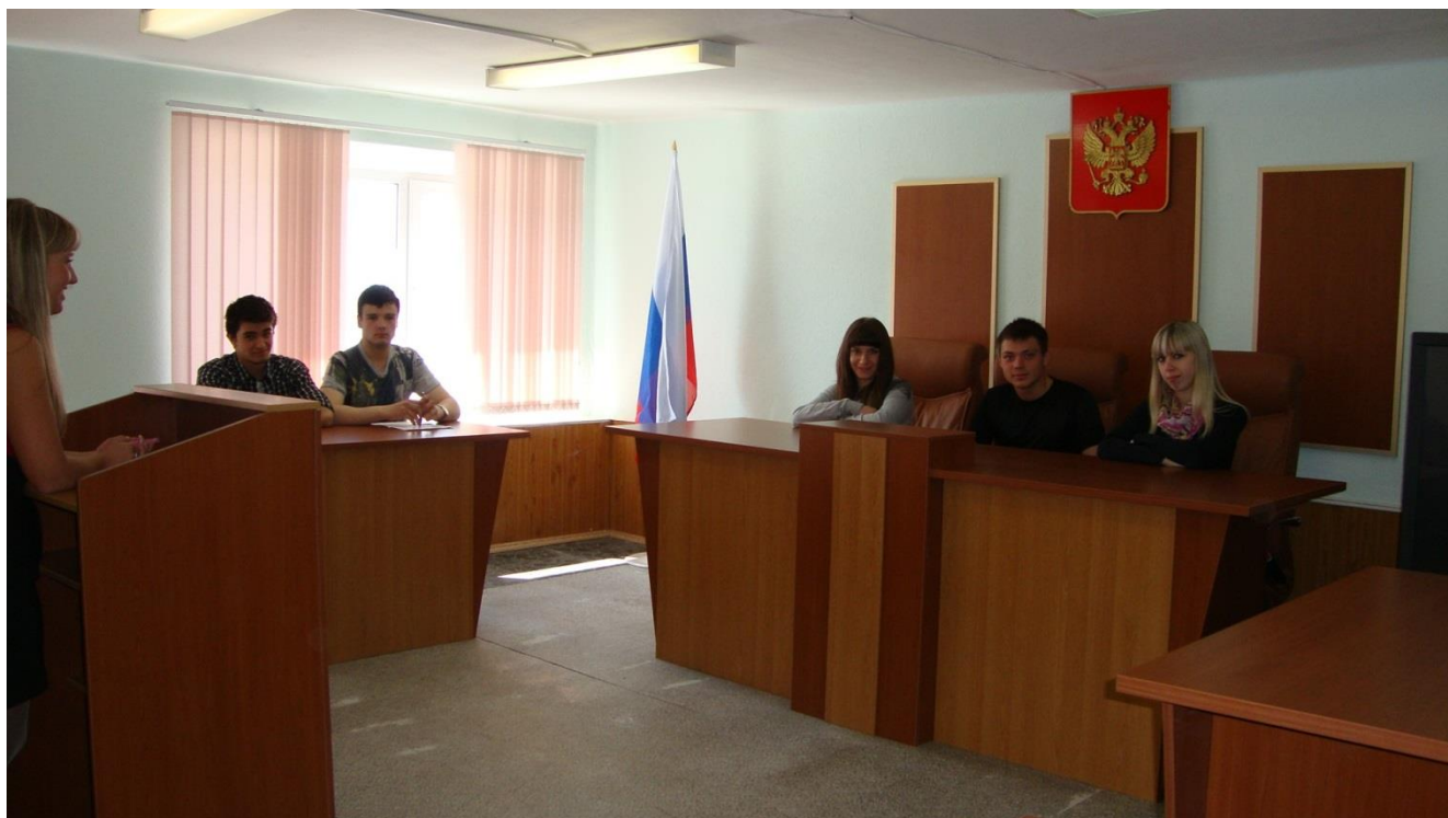
Учебный зал судебных заседаний

С учетом внешнеэкономического профиля вуза Дальневосточный филиал академии – единственный в Камчатском крае реализует образовательные программы с международной специализацией: «Международное право», «Мировая экономика», «Международное экономическое сотрудничество России со странами АТР» с углубленным изучением делового иностранного языка экономического, управленческого и юридического профилей; готовит магистров по направлению «Юриспруденция», а также единственная образовательная организация высшего образования в Камчатском крае, прошедшая общественную аккредитацию Союза «Торгово - промышленная палата Камчатского края» по всем реализуемым программам.