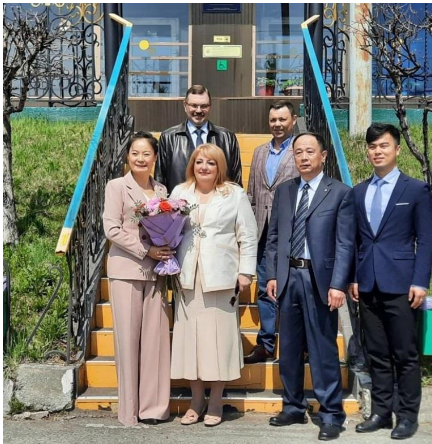
Генеральный консул КНР в г. Владивостоке Пяо Янфань в «ДВФ ВАВТ Минэкономразвития России»

С 2020 года, ежегодно, Правительством Российской Федерации выделяется квота на обучение 50-ти иностранных граждан в филиале за счет средств федерального бюджета. В 2024 году 14 граждан Китайской народной республики подали заявление на обучение в филиале по очно-заочной (вечерней) форме обучения за счет средств физических лиц на направление «Экономика» (профиль «Экономика предприятий и организаций»).