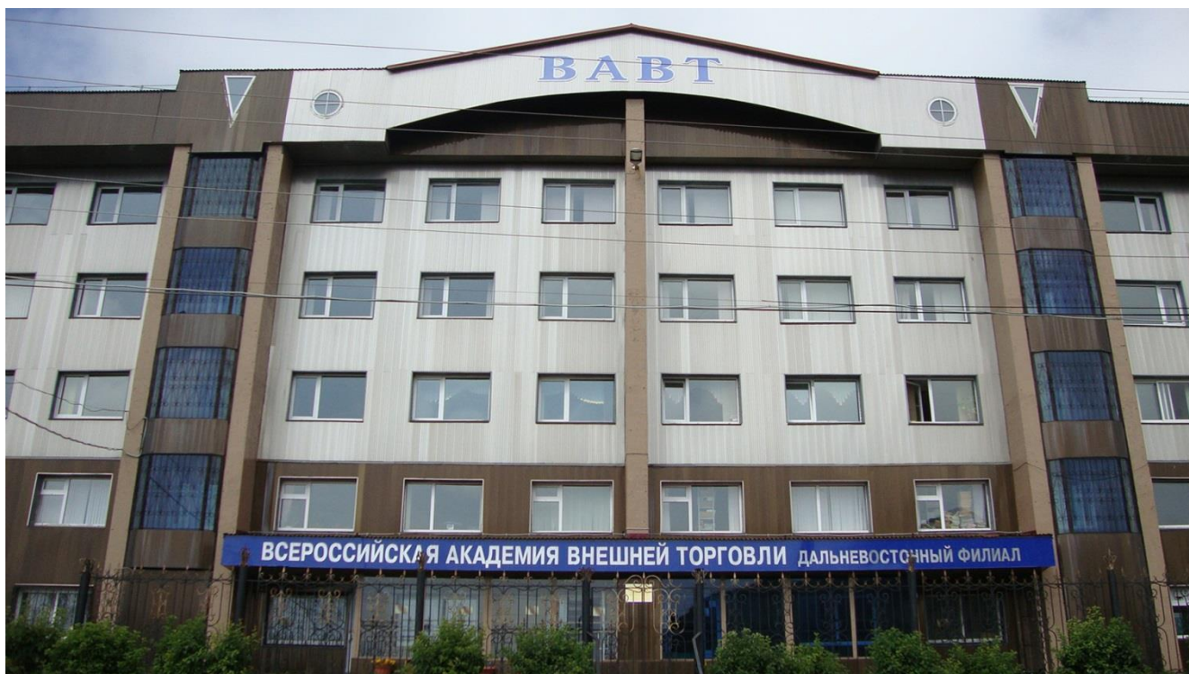
Учебно-административный корпус «ДВФ ВАВТ Минэкономразвития России»

В 1994 году в г. Петропавловске-Камчатском создан Дальневосточный филиал Всероссийской академии внешней торговли Министерства внешних экономических связей Российской Федерации (ДВФ ВАВТ Минэкономразвития России) с государственной целью подготовки высококвалифицированных кадров внешнеэкономического профиля для удовлетворения потребностей экономики Дальневосточного региона и с учетом необходимости развития внешнеэкономических связей со странами Азиатско-Тихоокеанского региона. Учредитель в настоящее время – Министерство экономического развития Российской Федерации. ДВФ ВАВТ Минэкономразвития России – единственный филиал академии в стране.